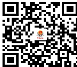
11.自然人代开租金收入发票