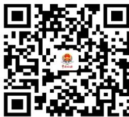
4.开具个人所得税纳税记录