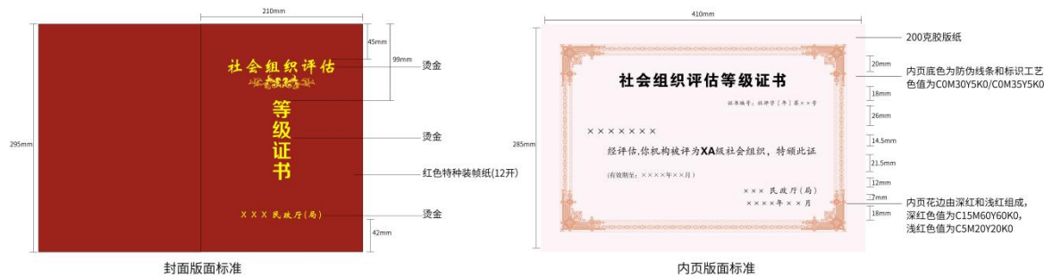
图 G.1 社会组织评估等级证书样式